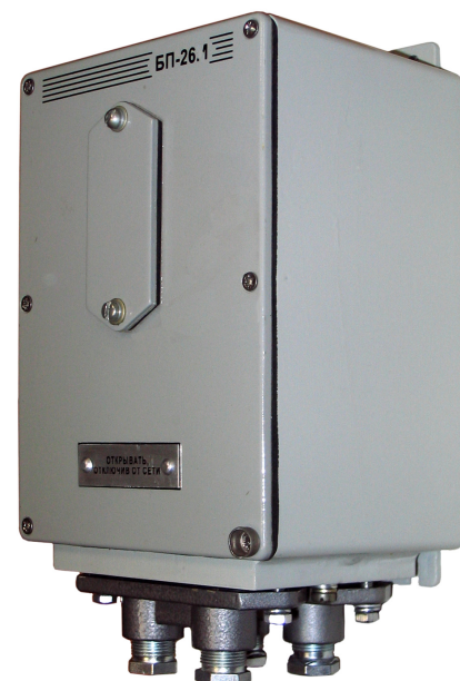
Блок питания БП-26.1