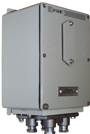
Блок питания БП-26.IIC

Блок питания с выходными искробезопасными электрическими цепями уровня «ib» предназначен для установки вне взрывоопасных зон помещений и наружных установок. Имеет маркировку [Ex ib Gb ]IIC.